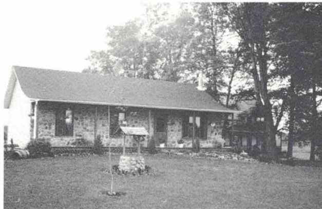
La maison familiale