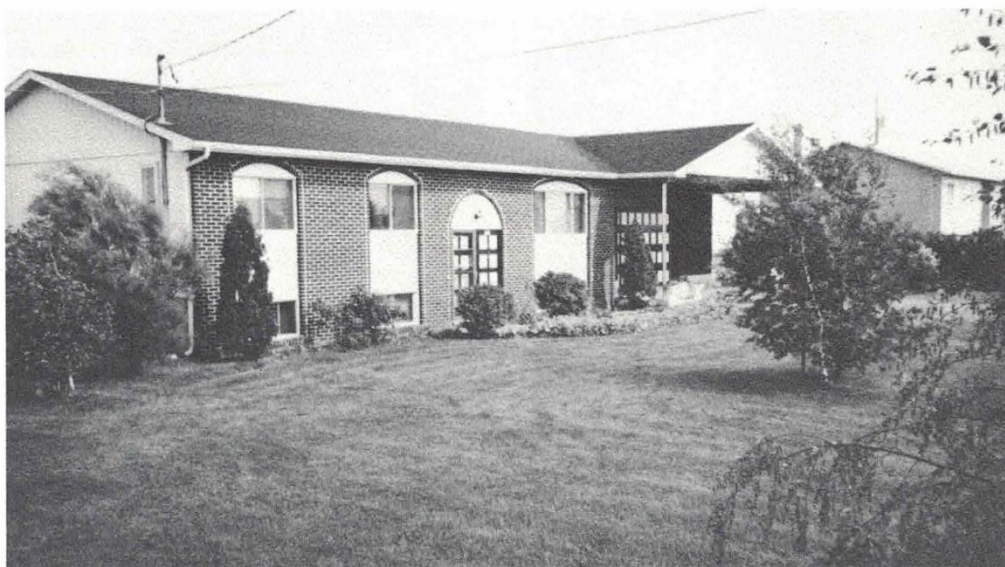
La résidence familiale

Nous sommes heureux de participer à l'album-souvenir du centenaire de Stanbridge-Station.