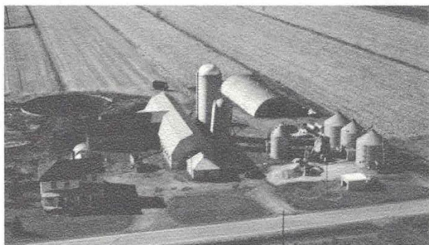
La ferme familiale

Au fil des ans plusieurs améliorations ont été apportées, tels que: l'agrandissement de l'étable, la construction d'un plan de séchage pour maïs et d'une remise à machinerie, la modernisation des installations et équipements de ferme et le drainage d'une partie de la ferme.