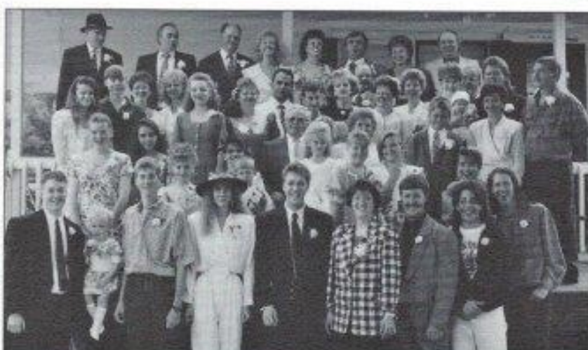
Enfants et petits-enfants